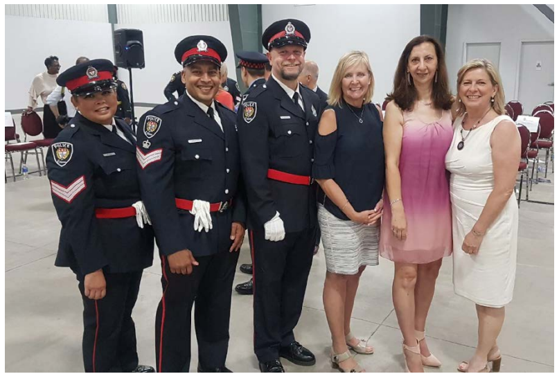
Le 19 juin, le Service de police d'Ottawa a accueilli 88 nouveaux agents de police lors de la cérémonie de remise des insignes aux recrues, au Centre EY.