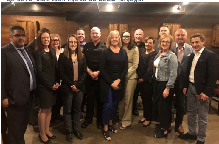
Le 8 mai, le Service de police d'Ottawa a organisé une réception au Barley Mow de Westboro pour remercier les commanditaires du gala du SPO et annoncer les bénéficiaires de l'année 2019, soit le Fonds Habineige et Opération rentrer au foyer.