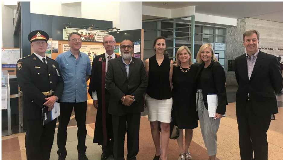
Le 27 juin, le SPO a célébré la 5 e édition annuelle de la Fête de la diversité, à l'occasion de la Journée canadienne du multiculturalisme et de la Journée nationale des peuples autochtones. Des membres de la CSPO étaient présents pour accueillir 25 nouveaux citoyens canadiens, conviés par Immigration, Réfugiés et Citoyenneté Canada pour prêter serment.